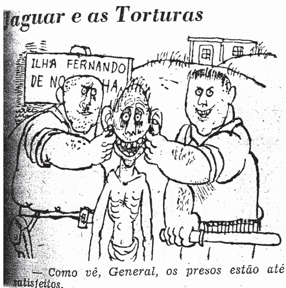
Figura 18: Última Hora, 19/09/64, Jaguar

O general Ernesto Geisel, quando ocupava a chefia da Casa Civil do governo Castelo Branco, foi enviado para investigar acusações de tortura em São Paulo, na Guanabara, em Pernambuco e no Rio Grande do Sul. Retornou da sua viagem de averiguação, negando qualquer